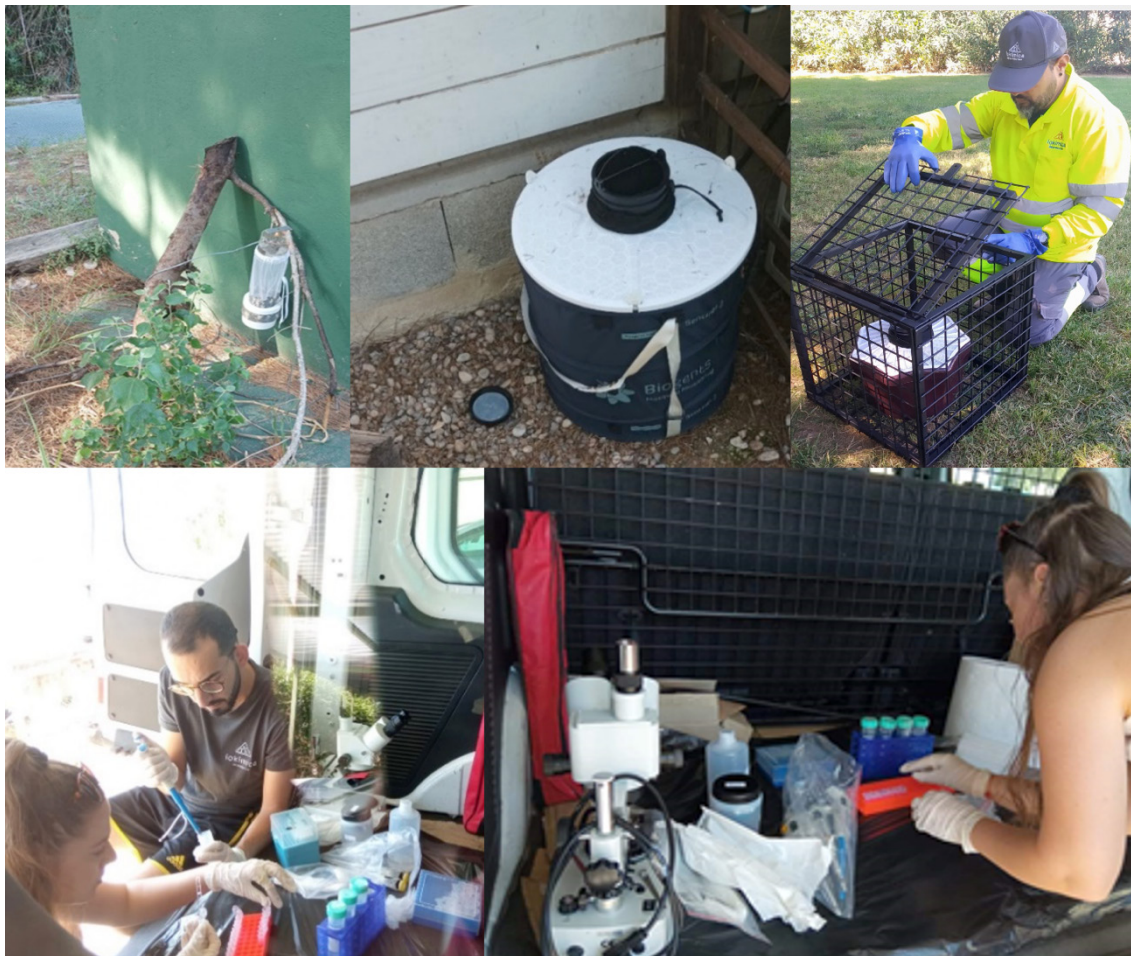
Figura 2. Imágenes relativas a los procedimientos de captura de mosquitos y procesados de muestras para la búsqueda interna de virus en condiciones de campo

El objetivo a corto plazo es que esta tecnología, contrastada técnica y científicamente, forme parte complementaria de los programas de vigilancia y control de vectores que las diferentes administraciones públicas desarrollan en nuestro país.