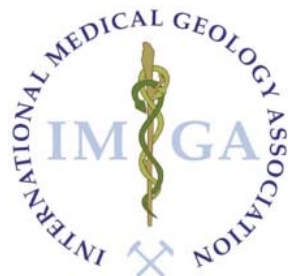
International Medical Geology Association, IMGA www.medicalgeology.org

La Geología Médica estudia las fuentes, presencia, distribución, concentración y química de elementos como el arsénico, flúor, selenio, plomo, cobre, cromo o uranio que pueden producir problemas de salud, tratando de establecer los canales de exposición para, en definitiva, producir mapas que ilustren sobre los factores geológicos y geoquímicos locales, regionales o globales, así como sus relaciones con problemas de salud existentes o potenciales.