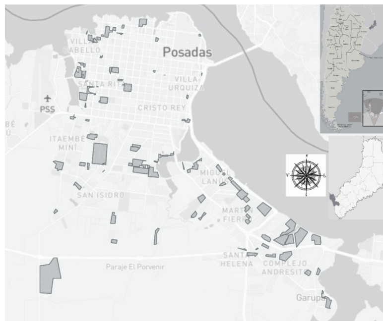
Figura1. Mapa de asentamientos informales en Posadas, 2016. La rosa de los vientos y los mapas de Argentina y Misiones son agregados del autor

El Trigal se emplaza en la zona de Villa Cabello, al margen de un importante arroyo afluente del río Paraná, y albergaba –al momento del trabajo de campo– unas 150 unidades domésticas, según datos del centro de salud (figura 1).